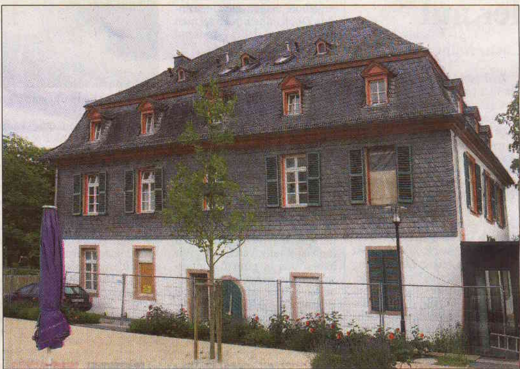
Der Bauzaun fällt – ein Schmuckstück ist wieder herausgeputzt: Das Jagdschloss an der Wiesbadener Fasanerie.

Zukünftig erwartet die Besucher in den Räumlichkeiten des Hauptgebäudes ein Restaurant. Hierfür wurde eigens ein im Baustil an das Schloss angelehntes Nebengebäude errichtet. Dort befindet sich neben den Lagerräumen für den Gaststättenbetreiber auch